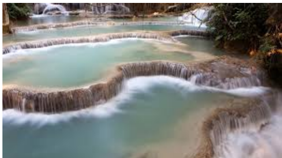
Фиг. 5. Повишаване пластичността на пространствата заети от водни течения и площи