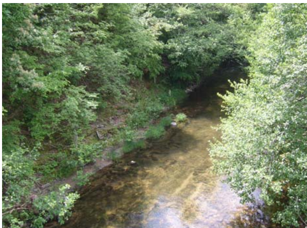
Фиг. 11. Поглед отвисоко към река Велека в участък от средното ѝ течение