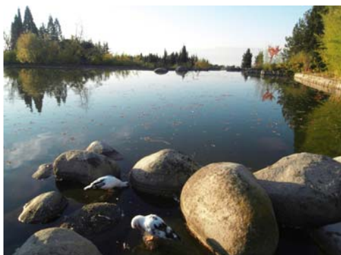
Фиг. 3. Хармонично вписана в пейзажа изкуствена водна площ в дворното пространство на хотел „Свети Врач“, гр. Сандански

Също така, те биват статични или динамични според това, дали водата в тях въздейства чрез спокойната си огледална повърхност, или чрез ефектите, които се получават при нейното движение (фиг. 4).