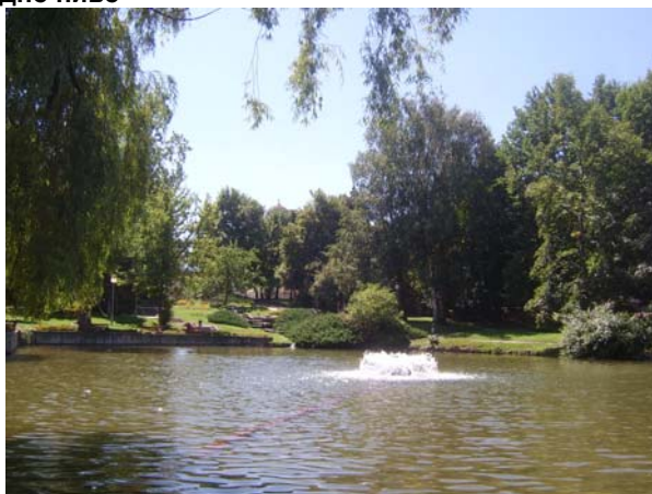
Фиг. 15. Водата в хармонично съчетание с подходяща растителност в парка на гр. Разлог