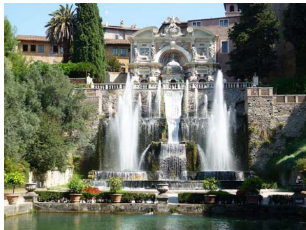
Фиг. 2. Композиционен център на ренесансовата вила д'Есте в град Тиволи, Италия

коректни проучвания относно водоизточниците в парковата територия и техния дебит, особеностите на геоложката основа, нивото на подземните води, конфигурацията на терена, технологията на строителство и т.н. В зависимост от това, дали се създават от човека или само се дооформят от него, водните елементи и съоръжения в парковата среда се делят на естестве-