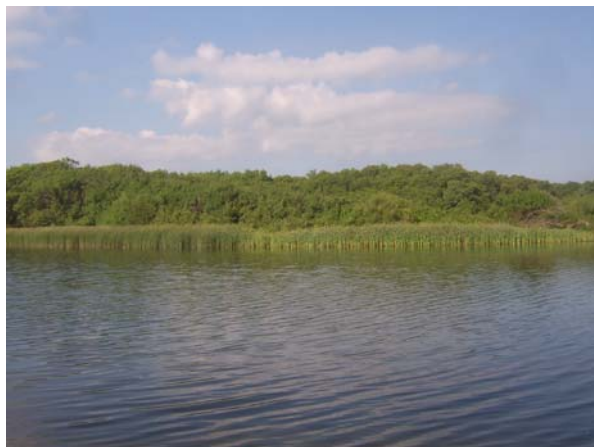
Фиг. 12. Поглед от полегатия бряг на лимана на река Силистар