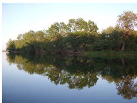
Фиг. 9. Способността на водата видимо да отразява околните предмети