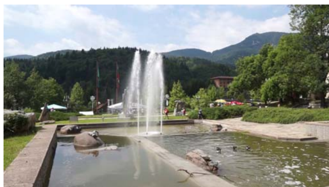
Фиг. 4. Статични и динамични въздействия на водните елементи в ландшафтната архитектура

Едно от основните приложения на водата в парковото изкуство е повишаване пластичността на пространствата (фиг. 5).