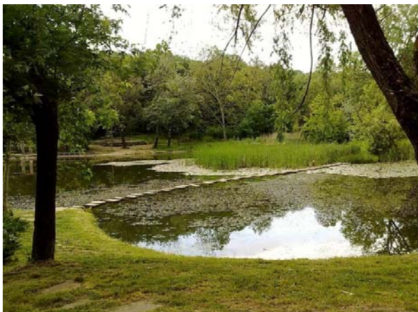
Фиг. 1. Водно огледало с пейзажни очертания в лесопарк „Липник“, гр. Русе