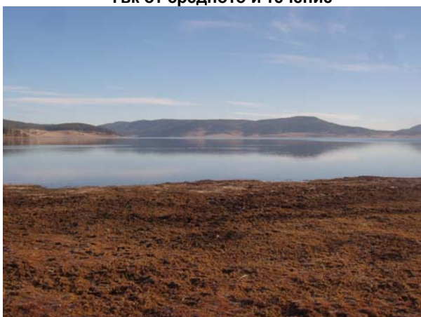
Фиг. 13. Отрицателни зрителни ефекти по крайбрежната ивица на язовир Батак през период на понижено водно ниво