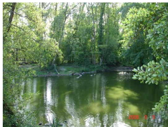
Фиг. 8. Водата в пейзажа оказва благоприятно въздействие върху психо-физическото състояние на човека