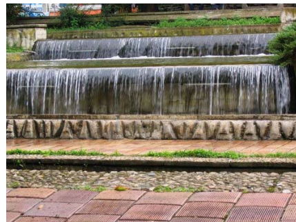
Фиг. 6. Декоративна водна каскада в гр. Плевен