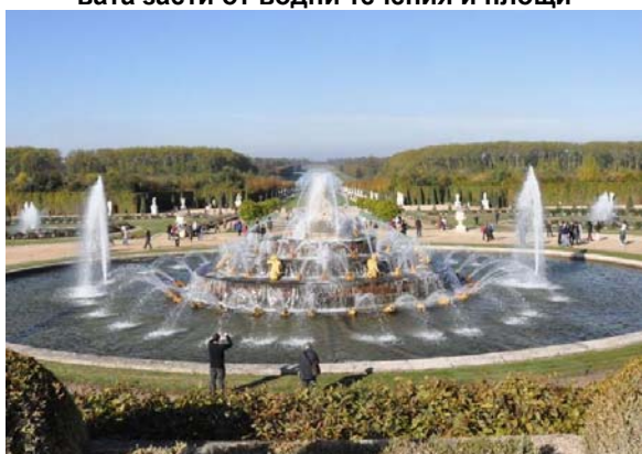
Фиг. 7. Фонтанът на Латона в парка на двореца Версай, Франция