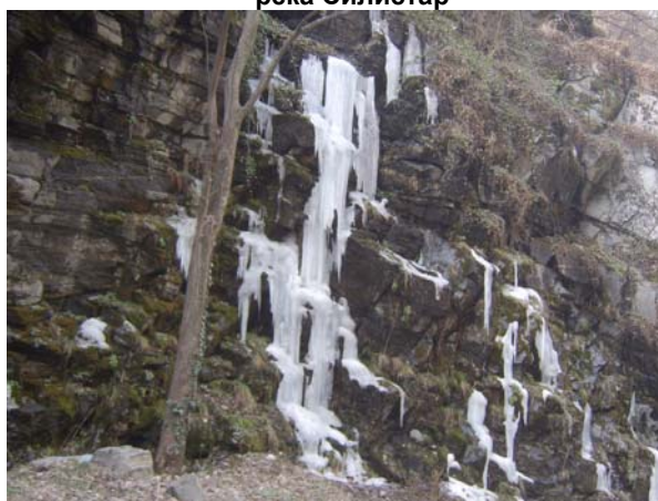
Фиг. 14. Водата е атракция в пейзажа дори в твърдо агрегатно състояние