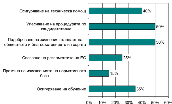
Фиг. 3. Оценка на мотивацията за кандидатстване по проект в сектор Води за периода 2014–2020

За 40% от анкетираните осигуряването на техническа помощ би било мотив за кандидатстване. 35% биха се мотивирали, ако се осигури обучение, а съответно за 25% и 15%, мотив би било спазването на регламентите на ЕС и промяната на изискванията на нормативната база.