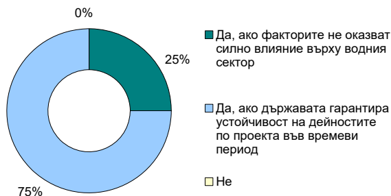
Фиг. 2. Нагласи за кандидатстване по проект в сектор Води, ако се променят факторите на външната среда

На въпроса, дали биха кандидатствали за проектно финансиране в сектор Води, ако се променят факторите на външната среда, 75% от анкетираните отговарят положително, но при условие, че държавата гарантира устойчивост на дейностите по проектите във времеви период (фиг. 2). Други 25% отговарят положително в случай, че факторите не оказват силно влияние върху водния сектор. Няма респондент, който да дава негативен отговор.