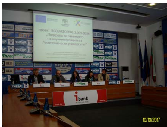
Фиг. 1. Пресконференция в БТА

През юли 2017 година в Лесотехническият университет стартира изпълнението на проект BG05M2OP001-2.009-0034 „Подкрепа за развитието на научния капацитет в Лесотехнически университет“, финансиран от Оперативна програма „Наука и образование за интелигентен растеж“ 2014–2020 г. във връзка с това на 10.10.2017 г. в БТА бе проведена пресконференция, на която бяха представени основните параметри на проекта.