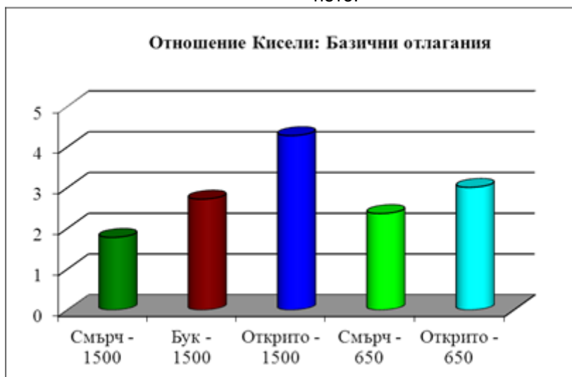
Фиг. 3. Отношение между отложената с валежите сума от кисели замърсители и сума от неутрализиращи базични катиони за 2014 г.

Особено внимание заслужават отлаганията на базични катиони с валежите, чиито стойности са много близки на откритата незалесена площ и на двете надморски височини, но на 1500 m под короните на смърча са измерени много по-високи отлагания на всички определени катиони, отколкото на открито. Така например под смърча са отложени 4 пъти повече \text{K}^+ йони ( 17,41 \text{ kg}\cdot\text{ha}^{-1}\cdot\text{yr}^{-1} ) и 3 пъти повече \text{Mg}^{2+} йони ( 3,07 \text{ kg}\cdot\text{ha}^{-1}\cdot\text{yr}^{-1} ), отколкото на открито ( 4,07 \text{ kg}\cdot\text{ha}^{-1}\cdot\text{yr}^{-1} за K и 0,90 \text{ kg}\cdot\text{ha}^{-1}\cdot\text{yr}^{-1} за Mg). На по-ниската надморска височина, обаче, само отлаганията на K са по-високи под короните на смърча ( 9,50 \text{ kg}\cdot\text{ha}^{-1}\cdot\text{yr}^{-1} ) спрямо откритата площ ( 4,90 \text{ kg}\cdot\text{ha}^{-1}\cdot\text{yr}^{-1} ). Отлаганията на Na и Ca са по-ниски под короните, а на Mg са почти еднакви ( 1,11 \text{ kg}\cdot\text{ha}^{-1}\cdot\text{yr}^{-1} ), както и на открито ( 1,05 \text{ kg}\cdot\text{ha}^{-1}\cdot\text{yr}^{-1} ) (табл. 1). Основната част от базичните йони се дължи на калиевите и калциевите йони във всички варианти на изследването.