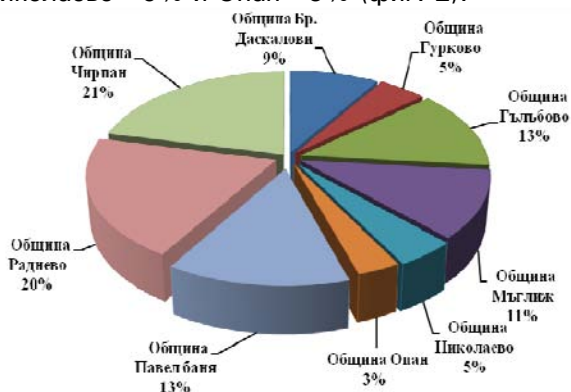
Фиг. 2. Разпределение на населението в селските райони по общини

По общини разпределението на населението е съответно Чирпан - 21%, Раднево - 20%, Гълъбово - 13%, Павел баня - 13%, Мъглиж - 11%, Братя Даскалови - 9%, Гурково - 5%, Николаево - 5% и Опан - 3% (фиг. 2).