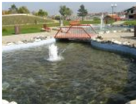
Фиг. 6. Водна площ

В зоната за пасивен отдих спадат водната площ (фиг. 6), лятно кино (фиг. 7), беседки, перголи, пейки и други.