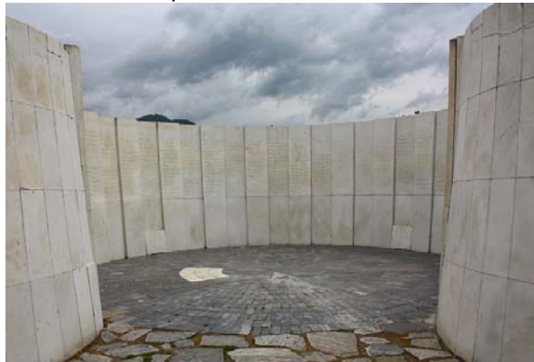
Фиг. 4. Крипта – обща гробница

където на мраморните плочи са изписани имената на падналите борци, отдали живота си за освобождението на Македония (фиг. 4).