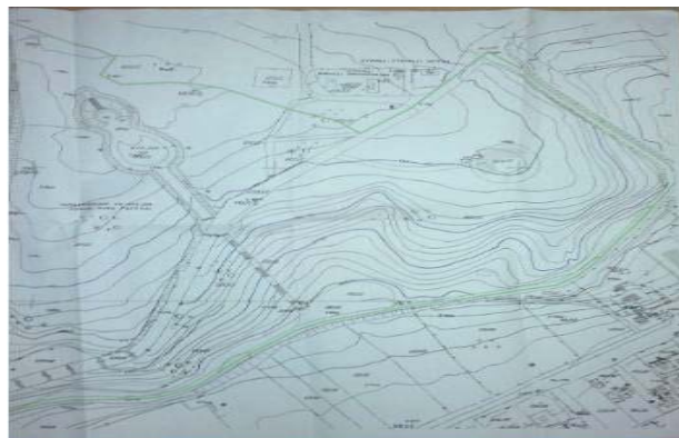
Фиг. 2. Карта на парк „Могила“

Централна зона. В парка е обособен единен център, който условно е разделен на три части: