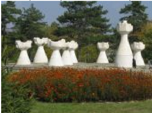
Фиг. 3. Мраморните урни

голямата урна със символ на вечен пламък, олицетворява непоколебимостта на македонския народ. Във втората част намира се Криптата – обща гробница,