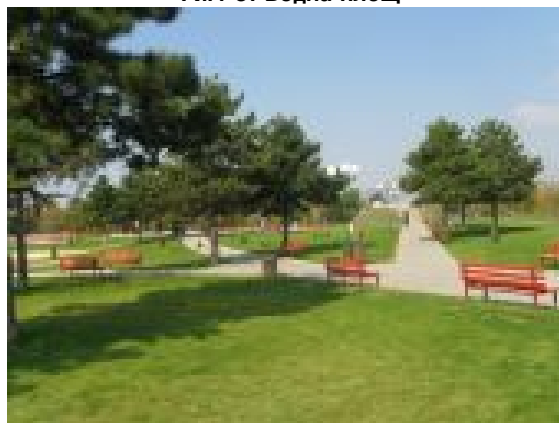
Фиг. 8. Част от зоната за пасивен отдих

Основния замисъл на парковата композиция е определена от алеината мрежа, която е разработена в пейзажен стил.