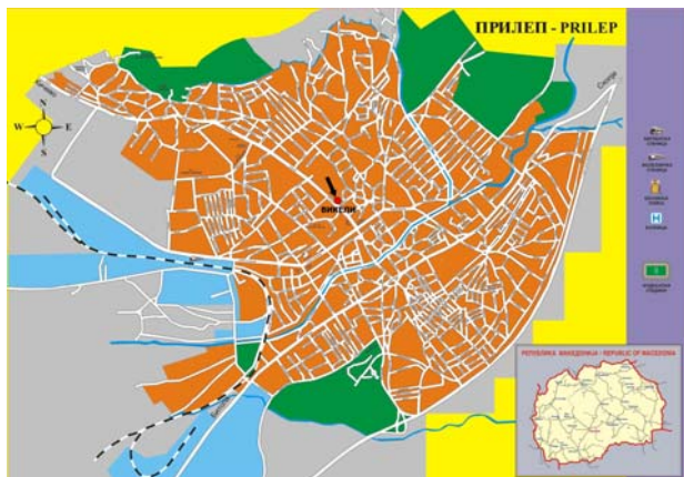
Фиг. 1. Карта на град Прилеп

„Могила“, остават с незабравими впечатления от него. Слънчевите поляни тук се сменят със закритите сенчести пространства. Значението на този парк е още по-голямо, тъй като той е единственият парк в Прилеп (фиг. 1).