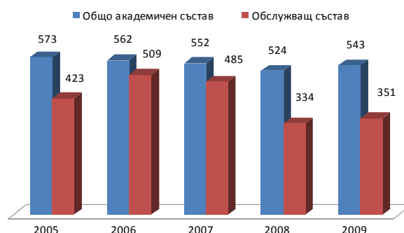
Фиг. 1. Научно-преподавателски състав на Тракийски университет (2005-2009 г.)

през 2009 г. се наблюдава повишаване числеността им с 3,5% спрямо 2008 г. (фиг. 1.).