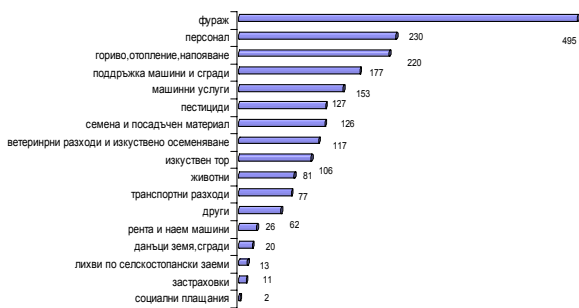
Фиг. 3. Разходи в лева за аграрна дейност средно на стопанство (в лв.)

Тъй като селскостопанските дейности свързани с растениевъдството са с изразен сезонен характер, са взети в предвид разходите направени не само през 2006 година, а за всички разходи за получената реколта през тази година.